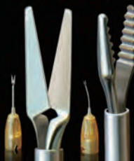
PCK-1001 シングルユースIOLカッターキット

※本製品は滅菌済での販売となります。再使用はできません。 ※上記先端部は専用ハンドル (DFH-1028) または、従来のハンドル (DFH-0028, DFH-0021) に取り付けご使用できます。 ※入数: 6本/箱