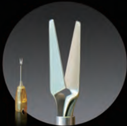
DFH-1012 シングルユース IOLカッター19G先端部