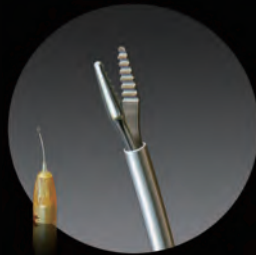
DFH-1019 シングルユース マイクロホールディング鉗子 23G先端部