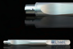
DFH-1028 シングルユース器具用ハンドル

内容: シングルユースIOLカッター 先端部3本 シングルユースマイクロホール ディング鉗子先端部3本